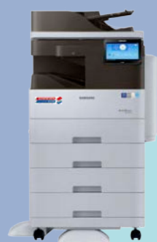
Alimentazione secondo cassetto + Supporto basso