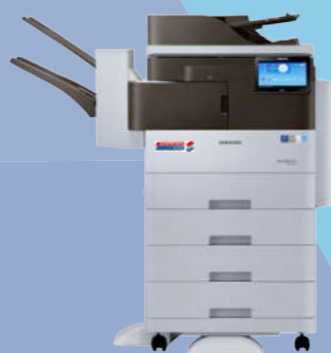
Finitore interno (2 vassoi) + Alimentazione secondo cassetto + Supporto basso