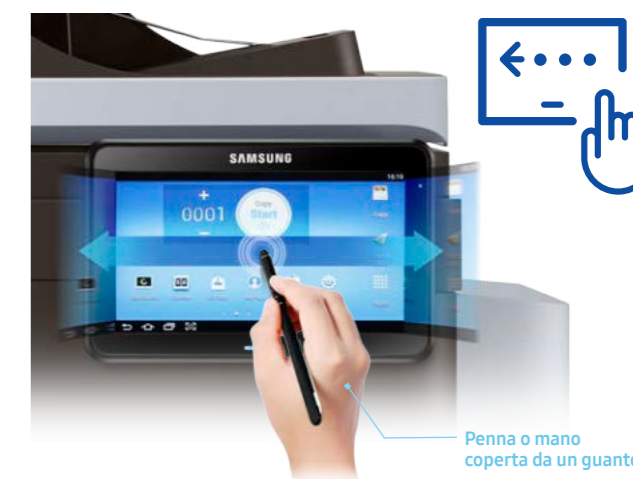
Penna o mano coperta da un guanto

La stampante SMART MultiXpress M5360RX è dotata di un pannello interattivo a sfioramento a infrarossi da 7 pollici che consente l'accesso a Smart UX Center. Include svariate funzionalità intelligenti, è facile da utilizzare ed è totalmente personalizzabile. L'eccezionale sensibilità consente agli utenti di sfruttare pienamente tutte le funzioni anche con una penna o con la mano coperta da un guanto.